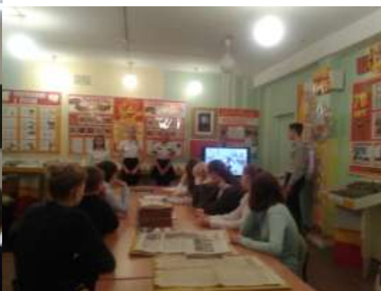
Урок в музее