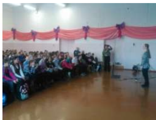
Беседа о ГТО