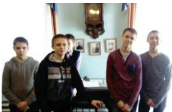
Посещение дом - музея семьи Сухановых