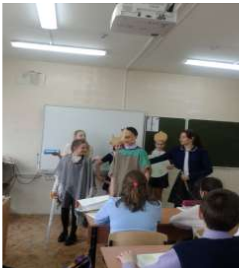
Урок истории в игровой форме